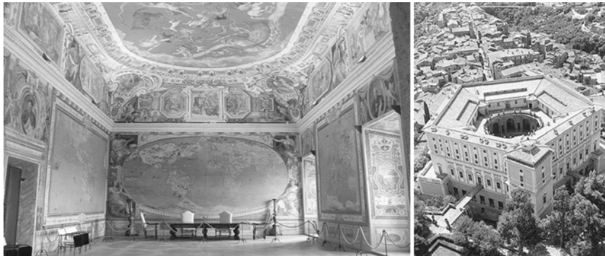
Abb. 70: Der Kartenraum und das erste Pentagon in Caprarola

Die wichtigsten Schwarzaadelfamilien der Archonten sind die italienischen Familien Farnese, Orsini, Aldobrandini und Chigi. Die Familie Farnese ist der Hauptarchitekt der Kabale, zusammen mit der Familie Borgia hat sie in den 1540er-Jahren die Jesuiten erschaffen. Die Familie Orsini ist sehr stark mit den Reptiloiden verbunden. Sie ist das Hauptverbindungsglied zwischen den physischen und nichtphysischen Archonten. Sie waren für den Pakt zwischen der Reptilienrasse und der römisch-katholischen Kirche zuständig. Die Familie Orsini verlor einen großen Teil ihrer Macht im Mai 2010. In der Familie Aldobrandini sind Seelen inkarniert, die sich vor Millionen von Jahren von der Quelle getrennt haben. In ihrem Besitz befinden sich geheime Dokumente über die Existenz von Atlantis und Fragmente von Ritualen der alten atlantischen Mysterien-schulen. Diese Familie ist sich der Bedeutung der Göttinnen-Energie bewusst. Die Familie Chigi sind die Bankiers der Jesuiten, und sie kontrollieren die Banca Monte dei Paschi di Siena in der Toskana. Diese Bank ist die älteste noch existierende Bank der Welt.